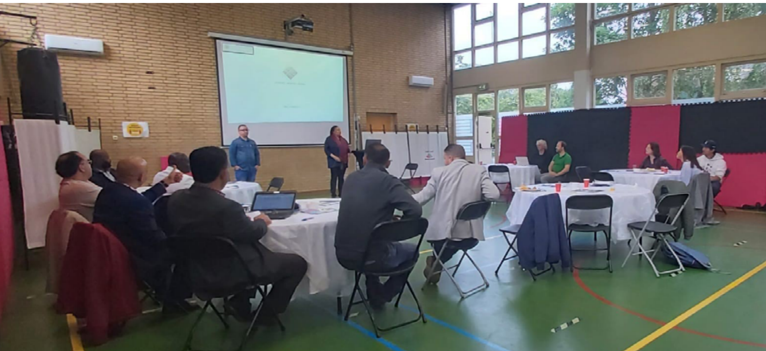
Bijeenkomst met sleutelfiguren gemeente Utrecht, bij de Assoenna Moskee.