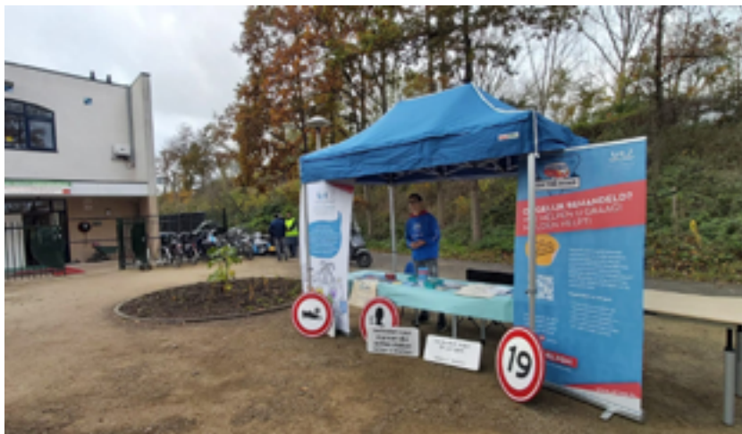
Kraam Art.1 MN on the Road bij Moskee Kanaleneiland.

Hoorcollege voor medewerkers Art.1 MN in het kader van een handelingsperspectief bij moslimdiscriminatie van Imam Abdeljalil Sayfaoui, 2020