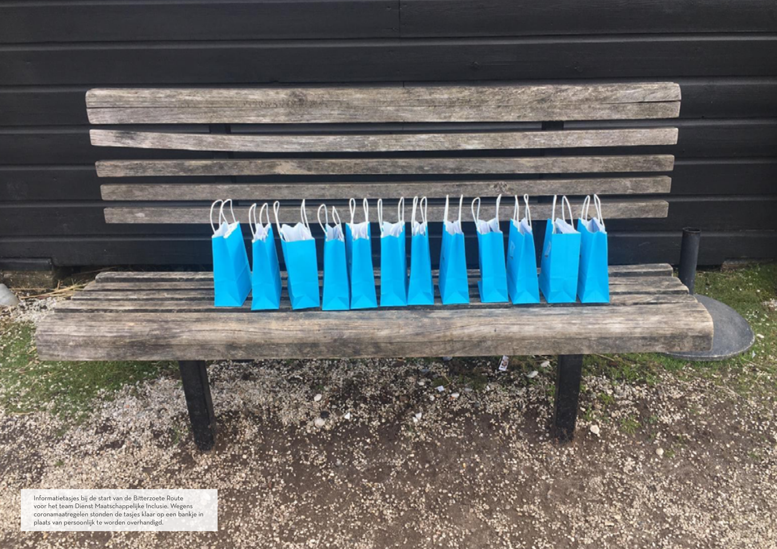
Informatietasjes bij de start van de Bitterzoete Route voor het team Dienst Maatschappelijke Inclusie. Wegens coronamaatregelen stonden de tasjes klaar op een bankje in plaats van persoonlijk te worden overhandigd.