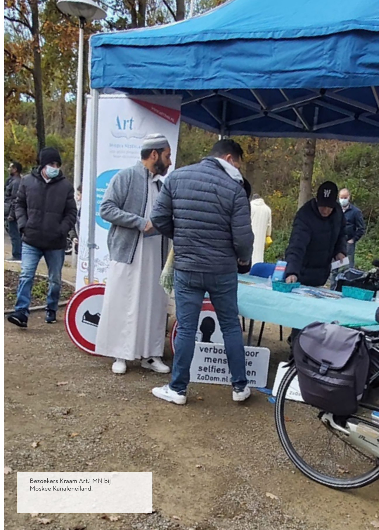
Bezoekers Kraam Art.1 MN bij Moskee Kanaleneiland.

Begin april 2021 heeft er een online overleg met voorzitters en imams van verschillende Utrechtse moskeeën plaatsgevonden. In het tweede kwartaal verscheen de factsheet 'Moslims in de provincie Utrecht'. Alle Utrechtse moskeeën zijn aangeschreven in verband met het opzetten van een mobiel meldpunt op locatie. Ook het oprichten van een stuurgroep voor het organiseren van jongerenbijeenkomsten werd in dit schrijven geopperd. Er zijn goede voortgangsgesprekken gevoerd met sleutelfiguren en vertegenwoordigers van de Islamitische gemeenschap. Echter, de berichten in de pers over vermeende spionage bij moskeeën en strubbelingen met het gemeentelijk bestuur hebben het