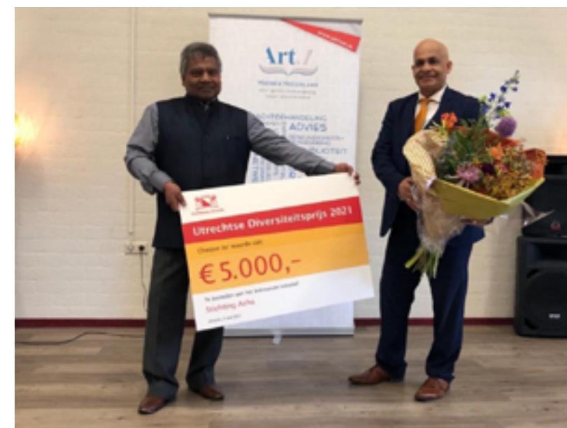
Voorzitter en Secretaris van Stichting Asha, Winnaar Diversiteitsprijs 2021.