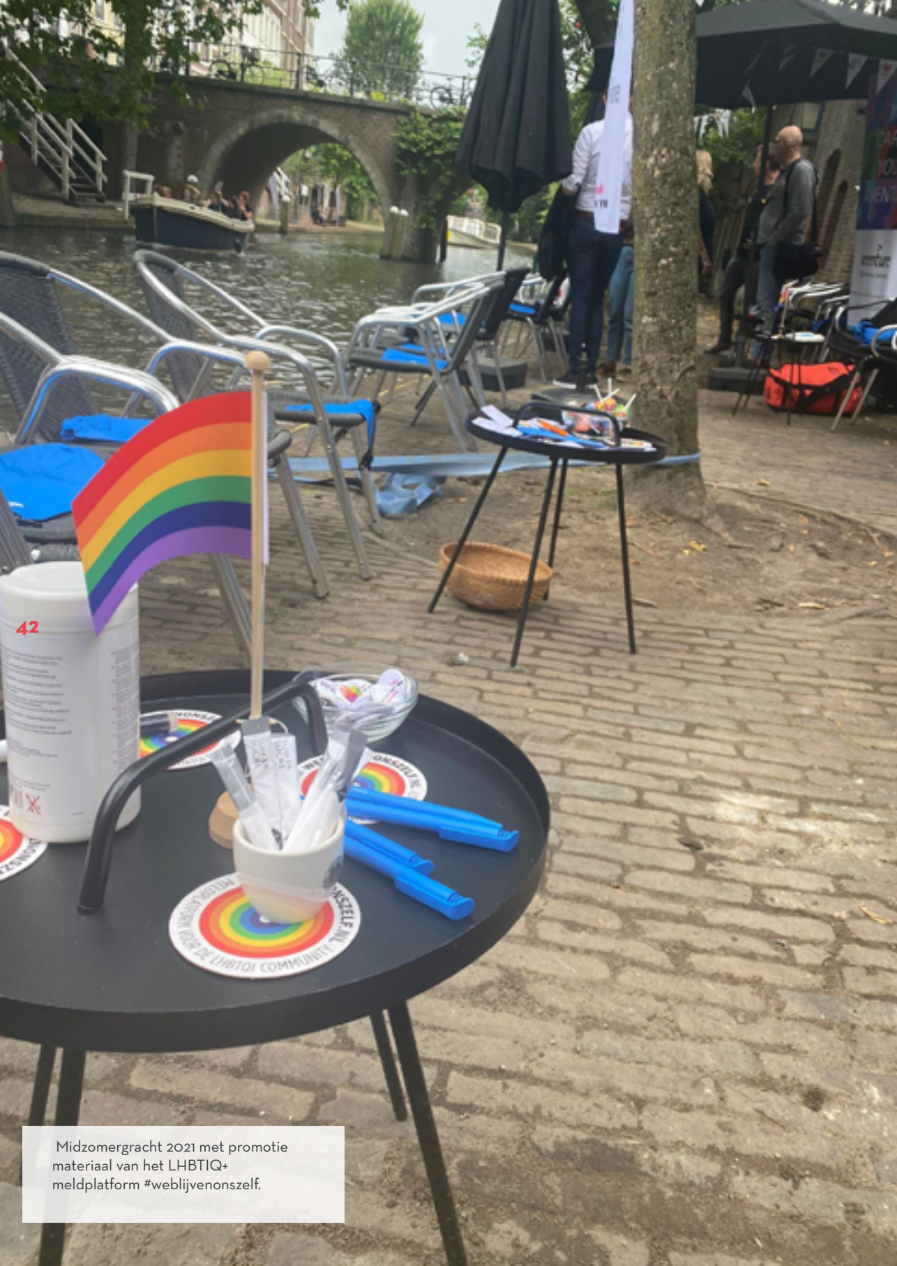
Midzomergracht 2021 met promotie materiaal van het LHBTIQ+ meldplatform #weblijvenonzelf.