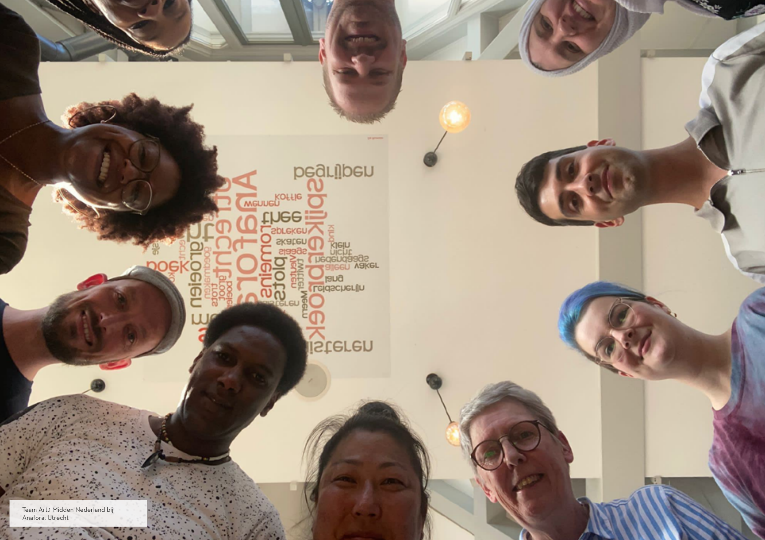
Team Art.1 Midden Nederland bij Anafora, Utrecht