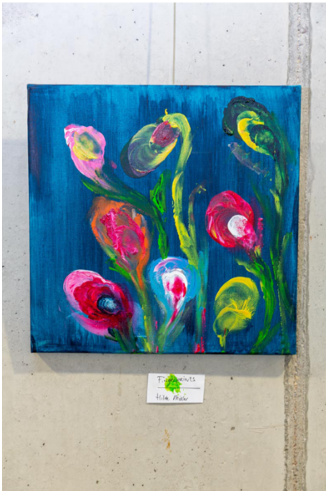
Een studente van de Scholen in de Kunst, Amersfoort, leverde deze tekening voor de Eindejaar kaarten van Art.1 MN bestemd voor burgers met een verhoogd risico op eenzaamheid.