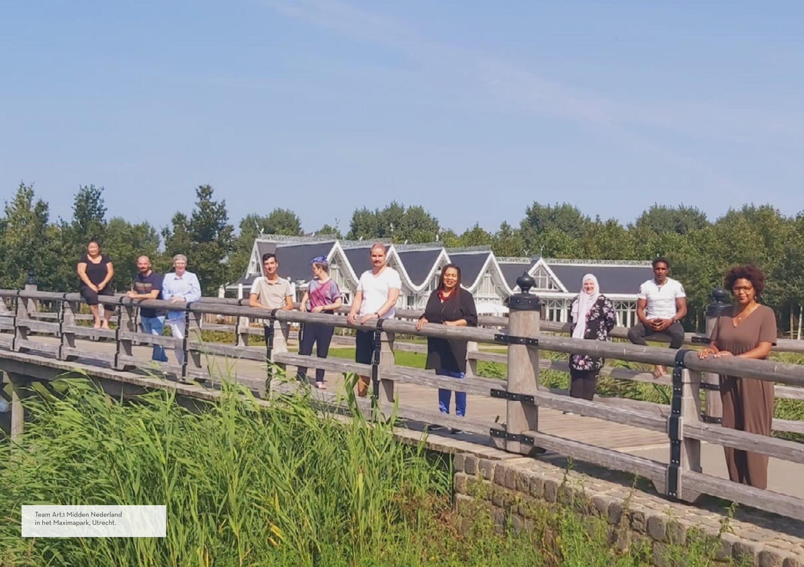
Team Art.1 Midden Nederland in het Maximapark, Utrecht.