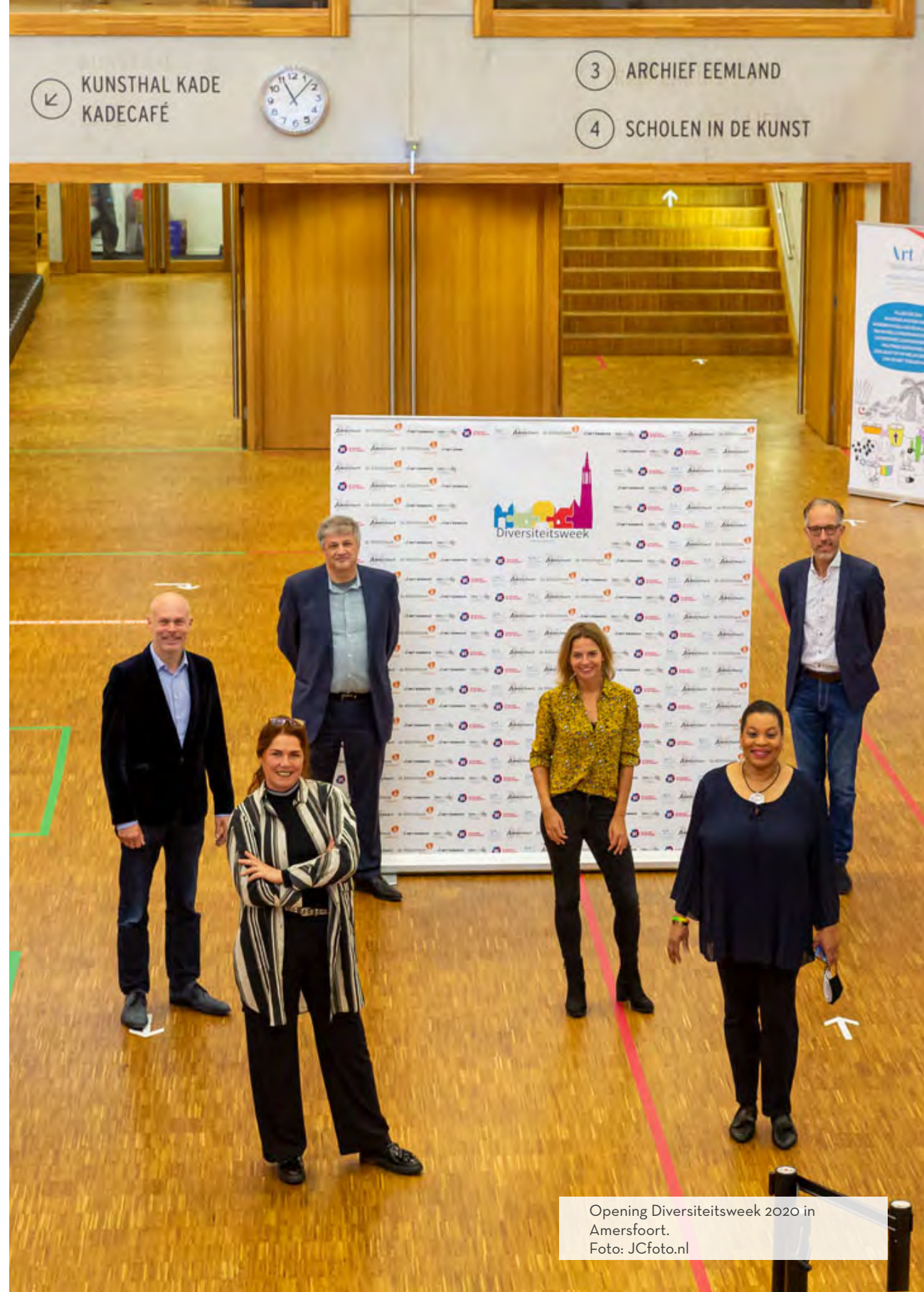
Opening Diversiteitsweek 2020 in Amersfoort.