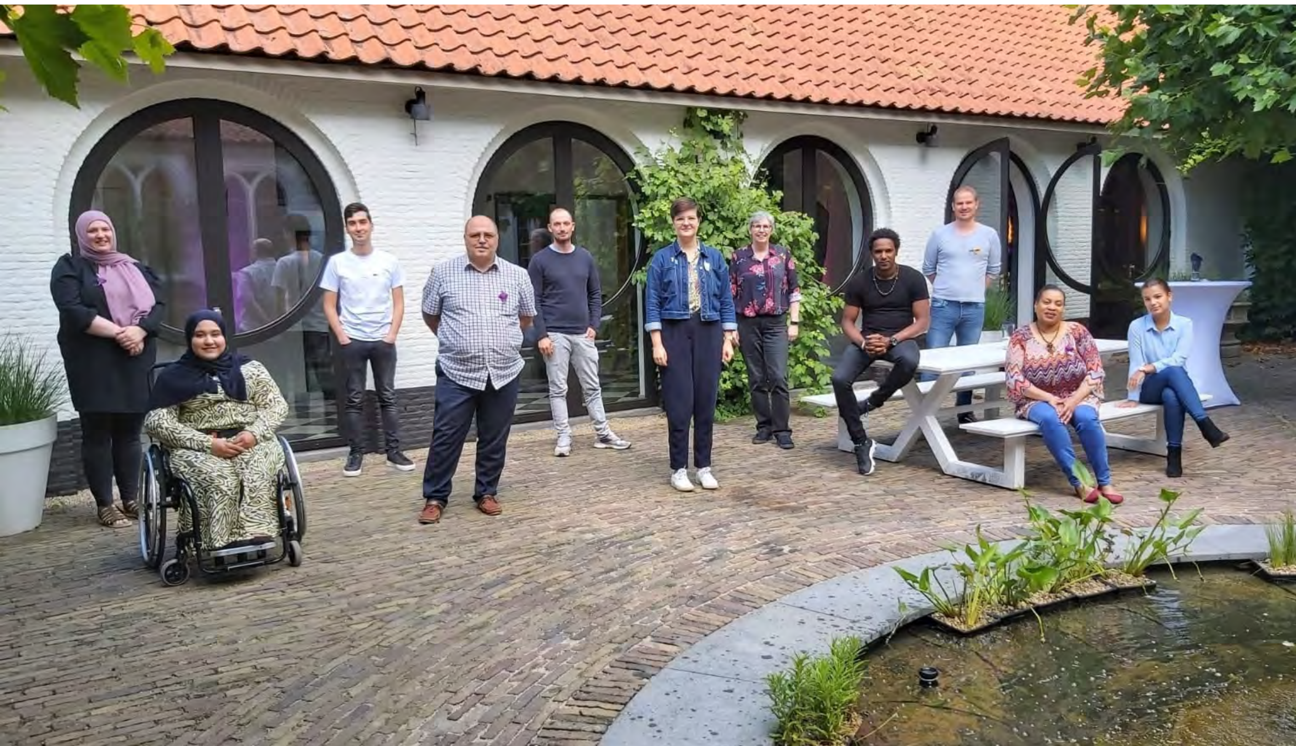
Teamdag in het Mariënhof in Amersfoort, juli 2020