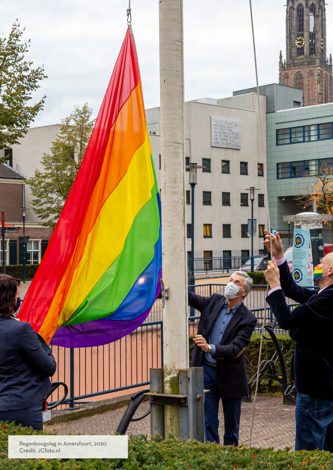
Regenboogvlag in Amersfoort, 2020