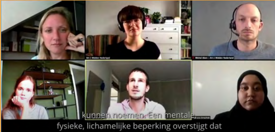
Screenshot uit het Panelgesprek Toegankelijkheid, georganiseerd in oktober 2020.