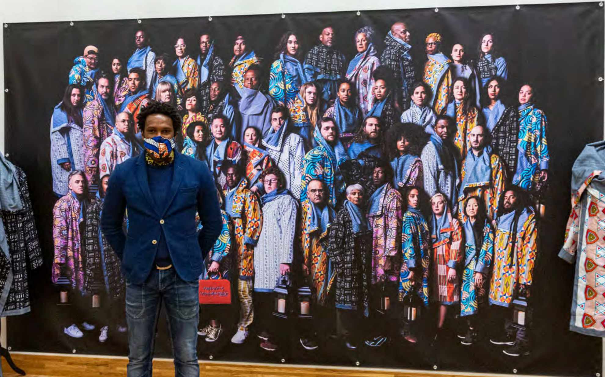
Opening Diversiteitsweek 2020 in Amersfoort